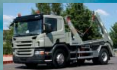
Schiffmann Transport AG, Weiningen P380LB4x2MHZ