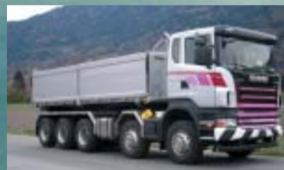
Othmar Hardegger AG, Zizers SCANIA R420CB10x4*6HHZ Euro4