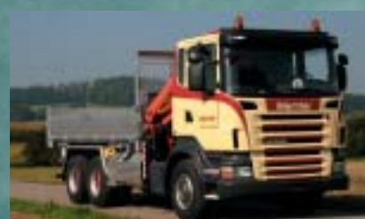
Badertscher Transporte und Logistik AG, Ohringen SCANIA R420CB6x4HNZ Euro4