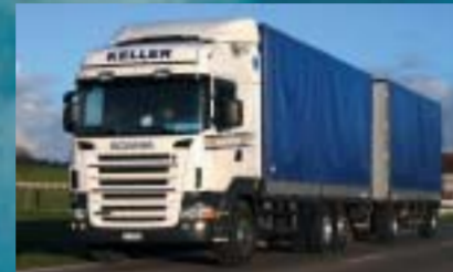
Keller Transport, Matzingen SCANIA R420LB6x2*4MNA, Euro4