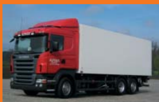
Alpiger Transport GmbH, Alt St. Johann 2 Stück SCANIA R420LB4x2MNB Euro4