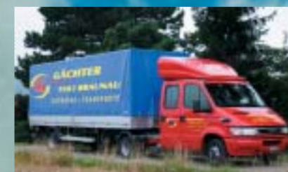
Transporte Gächter GmbH, Braunau IVECO 35C17/35T Daily City Truck