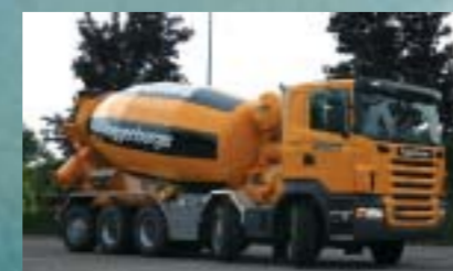
Toggenburger AG, Winterthur SCANIA R420CB10x4*6MNA Euro4