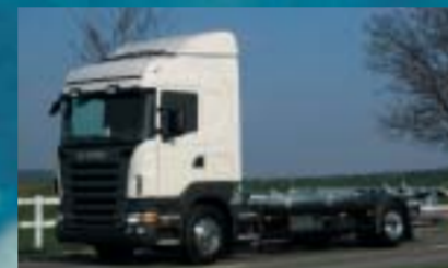
Alba Transporte und Umzüge GmbH, Regensdorf SCANIA R340LB4x2MNB Euro4