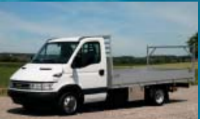
Boretti AG, Erlen IVECO 35C17 Daily City Truck