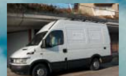
P+P Pepa Bau GmbH, Effretikon IVECO 29L13V Daily City Truck