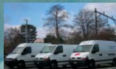
Transport Jucker, Seuzach 3 RENAULT Master 120.35 DCI