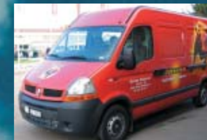
Banner Batterien Schweiz AG, Felben Renault Master 120.35