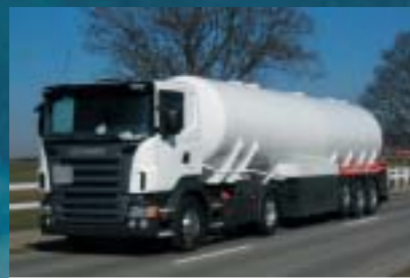
Tank-Trans GmbH, Tägerschen SCANIA R420LA4x2MNA Euro4