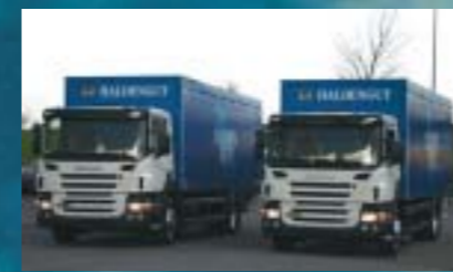
Heineken Switzerland AG, Winterthur 2 Stück SCANIA P340LB4x2MNA