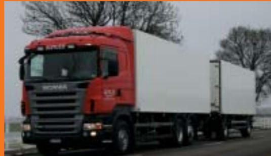
Alpiger Transport GmbH, Alt St. Johann 2 Stück SCANIA R420LB4x2MNB Euro4