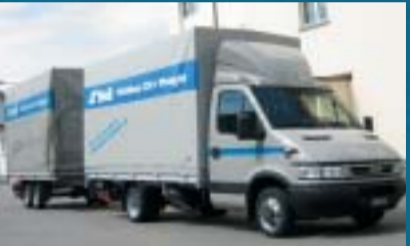
Stoll Transport AG, Pfäffikon ZH IVECO 35C17 Daily City Truck