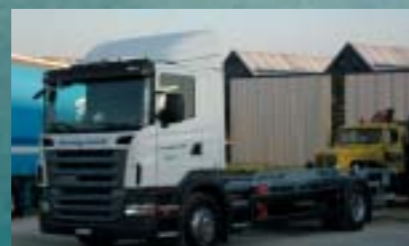
Steiner Express GmbH, Eschenbach R380LB4x2MNB