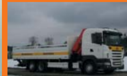
Sto AG, Niederglatt SCANIA R420LB6x2*4HNA Euro4