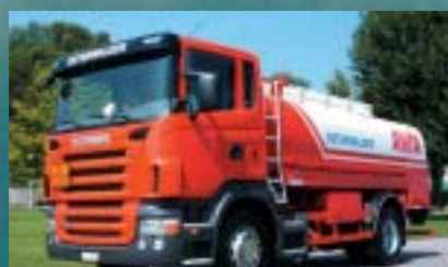
Osterwalder St. Gallen AG, St. Gallen SCANIA R 420LB4x2MNA Euro4