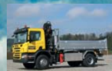
W. Strausak AG, Münchwilen SCANIA P340CB4x2HHZ