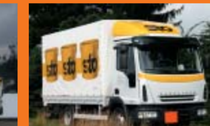
Sto AG, Niederglatt IVECO ML 75E17/P EuroCargo