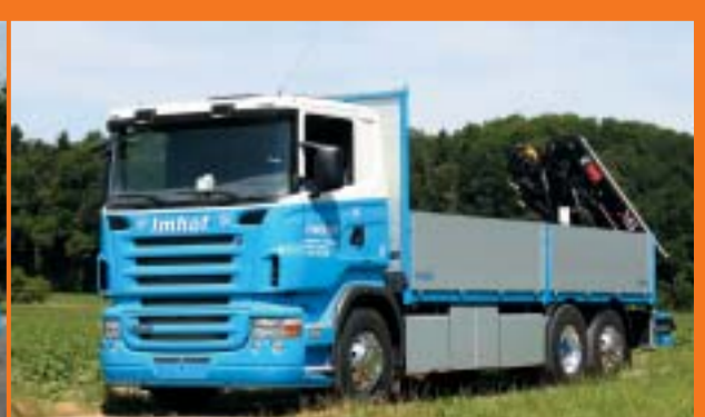
TIT Imhof AG, Stein am Rhein SCANIA R420LB6x2*4HNA Euro4