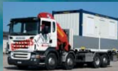
Baltensperger AG, Seuzach Sc R420LB8x2*6HNB Euro4