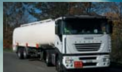
Tank-Trans GmbH, Tägerschen IVECO Stralis AS 440S43T/P Euro5