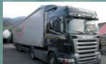
Höhener Transport AG, Ramsen R 420LA4x2MNA Euro4