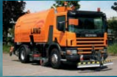
Tiefbauamt Kanton Thurgau, Frauenfeld SCANIA P114GB4x2NB