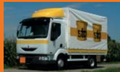
Sto AG, Niederglatt RENAULT Midlum 180.08/B (7,5 to)