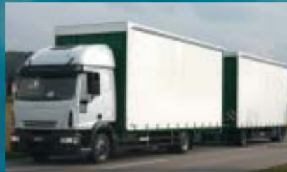
Stamm GmbH, Neunkirch IVECO ML 120E28/P