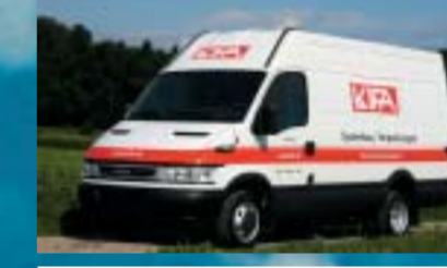
Kifa AG, Aadorf IVECO 35C17V Daily City Truck