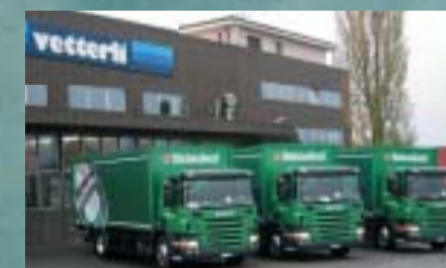
Heineken Switzerland AG, Winterthur 3 Stück SCANIA P340LB4x2MNA