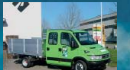
Raymann AG, Frauenfeld IVECO 35C12D Daily City Truck