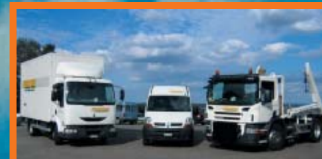
Zecchine Transport AG SCANIA P310DB4x2MNA RENAULT Midlum 220.09/B RENAULT Master 100.33DCI