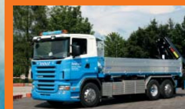
TIT Imhof AG, Stein am Rhein SCANIA R420LB6x2*4HNA Euro4