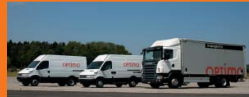
Optimo Service AG, Winterthur IVECO 35C17V/P und IVECO 35S17V SCANIA R420LB4x2MNA Euro4